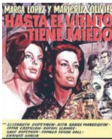
Hasta el Viento Tiene Miedo

Sin embargo, siempre se regresa al cine cuando hay que llenar tiempos o llamar la atención del público. No hay muchas novedades respecto al año anterior, pero aquí queda un resumen que, finalmente, suena repetitivo, pero deja constancia que la televisión permite que surja el júbilo o el asco: ni modo.