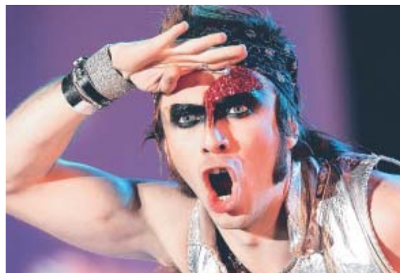
El vocalista del grupo dijo que no traerán una súper producción, pero sí un buen show.

El vocalista dijo que es por el éxito y proyección que el grupo logró con su anterior producción Detector de Metal que el público no se cansa de